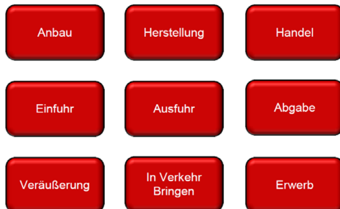
Abbildung 1: Tätigkeiten mit Erlaubnisvorbehalt

bedarf der Erlaubnis des Bundesinstitutes für Arzneimittel und Medizinprodukte.