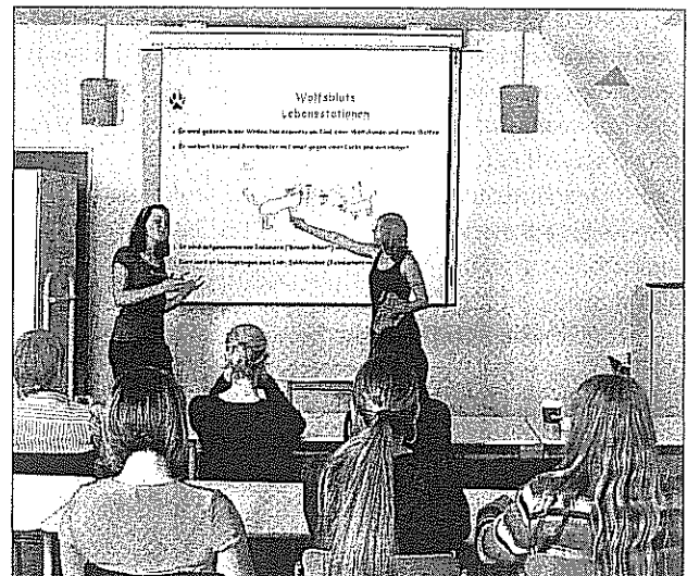
...und heute

Und mir jedenfalls ist kein Organisationsmodell bekannt, das eine effizientere und ressourcenschonendere Erfüllung der kommunalen Pflichtaufgabe der Medienbereitstellung für Schulen möglich macht. Dies gilt insbesondere deshalb, weil die Organisationsform des Medienzentrums nicht nur die Schulen, sondern in Kreisen auch die einzelnen Schulträger von der Beschaffung und Bereitstellung von Medien entlastet.