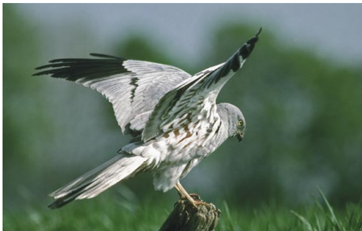
Der Schutz der Wiesenweihe, hier ein Männchen, steht für viele gefährdete Feldvögel in der Hellwegbörde.

Die jahrhundertealte Kulturlandschaft der Hellwegbörde zwischen Unna und Paderborn ist Lebensraum der Wiesenweihe und weiterer typischer Feldvögel wie Rebhuhn, Wachtel, Wachtelkönig, Feldlerche und der hier fast verschwundenen Grauammer. In den Frühjahrs- und Herbstmonaten nutzen Schwärme von Kiebitzen und Goldregenpfeifern und zahlreiche Rotmilane die Ackerflächen als Rast- und Nahrungsplätze. Weitere bemerkenswerte Rastvogelarten sind Kornweihe, Merlin und Mornellregenpfeifer. Auf Grund der hohen überregionalen Bedeutung der Hellwegbörde für diese Vogelarten wurde das Gebiet vom Land Nordrhein-Westfalen als Europäisches Vogelschutzgebiet ausgewiesen.